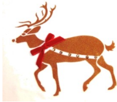
Motiv: stolzer Hirsch Farbe: braun