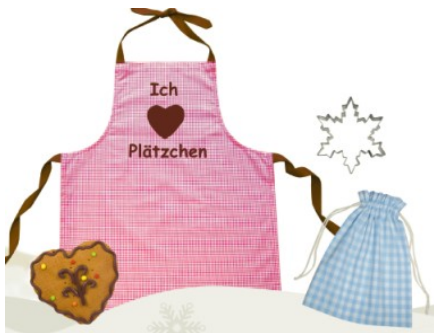
Motiv: Backschürze Farbe: Vichy Karo: rosa,rot,blau „Ich liebe Plätzchen“ Set: Backschürze+Stoffsäckchen+Ausstechform