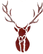
Motiv: Geweih Hirsch Farbe: braun, lila, pink