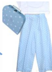
Pyjama Junge im blauen Köfferchen

Motiv: Aladin „Nachtschwärmer“ Farbe: blau Set: Pyjama+Koffer oder alternativ im Stoffsäckchen