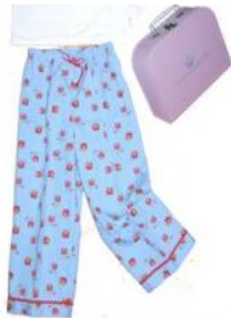
Pyjama Mädchen im rosa Köfferchen

Motiv: Erdbeere „ Träum süß“ Farbe: hellblau Set: Pyjama+Koffer oder alternativ im Stoffsäckchen